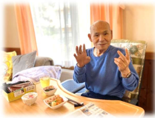
こちらも4月6日 S様、カメラを向けると必ずポーズをしてくれます！毎回いい写真が撮れます！