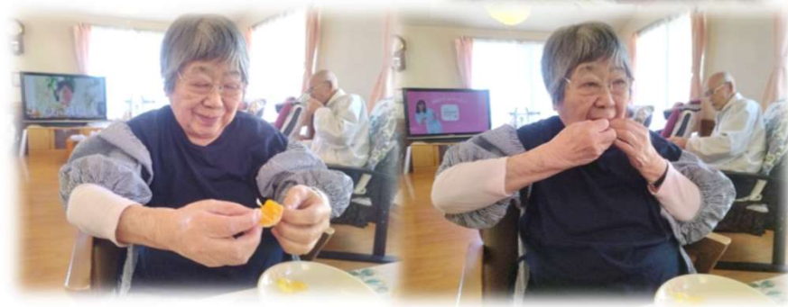
4月22日 N様のご家族からデコポンが届き、 早速食べている様子です！！器用に 身を取り出して美味しそうに食べて ました^^ この光景を見ると、よだれが出ちゃ いますね（笑） 他の入居者様も自分で剥ける人は自 分で剥いて食べてました！