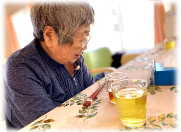
N様、スタッフの携帯でかわいい動物の動画を見て、微笑んだり肩を揺らして笑ったりして楽しんでました！