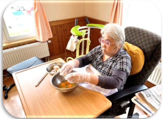
卵を割ってボールに→