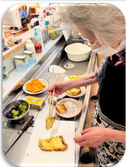
←フレンチトースト作り