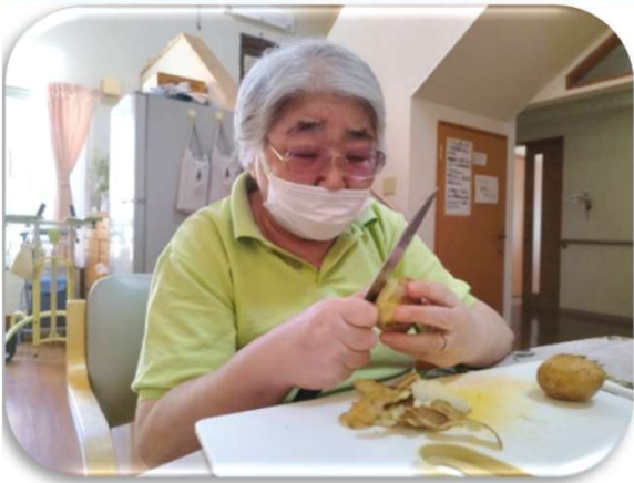
←じゃがいもむきむき