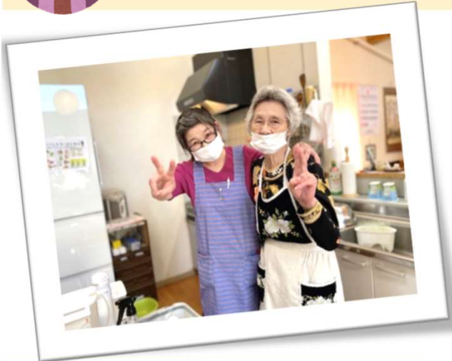
4月6日（二枚とも） スタッフとM様が肩を組んで仲良く撮影！お二人が台所に立って料理をしてくれます！